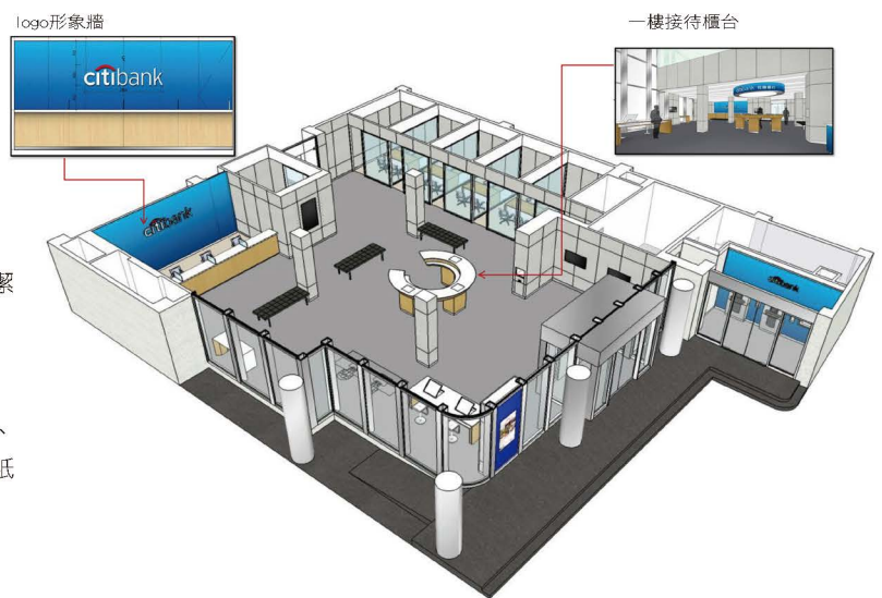
一層空間透視示意圖