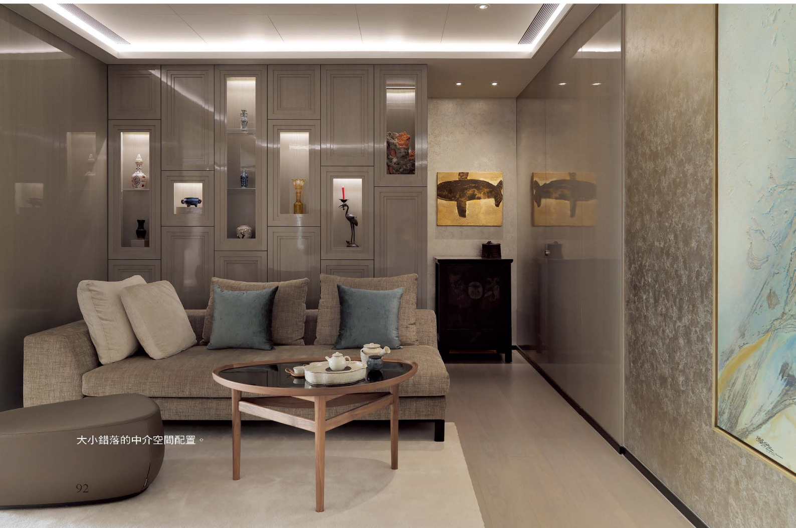
大小錯落的中介空間配置。