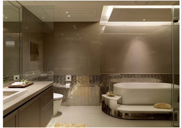
衛浴空間線條簡潔、現代又不失感性氛圍。

住宅設計必須貼近使用者的生活與心理需求，這需要設計者用心去了解與觀察，例如家人之間的關係，藉由室內設計可促進家人之間的親密互動，也可以讓家人各自保持生活的隱私與適當的距離。這個案子很榮幸獲得銀獎，我們將會持續再接再厲。■