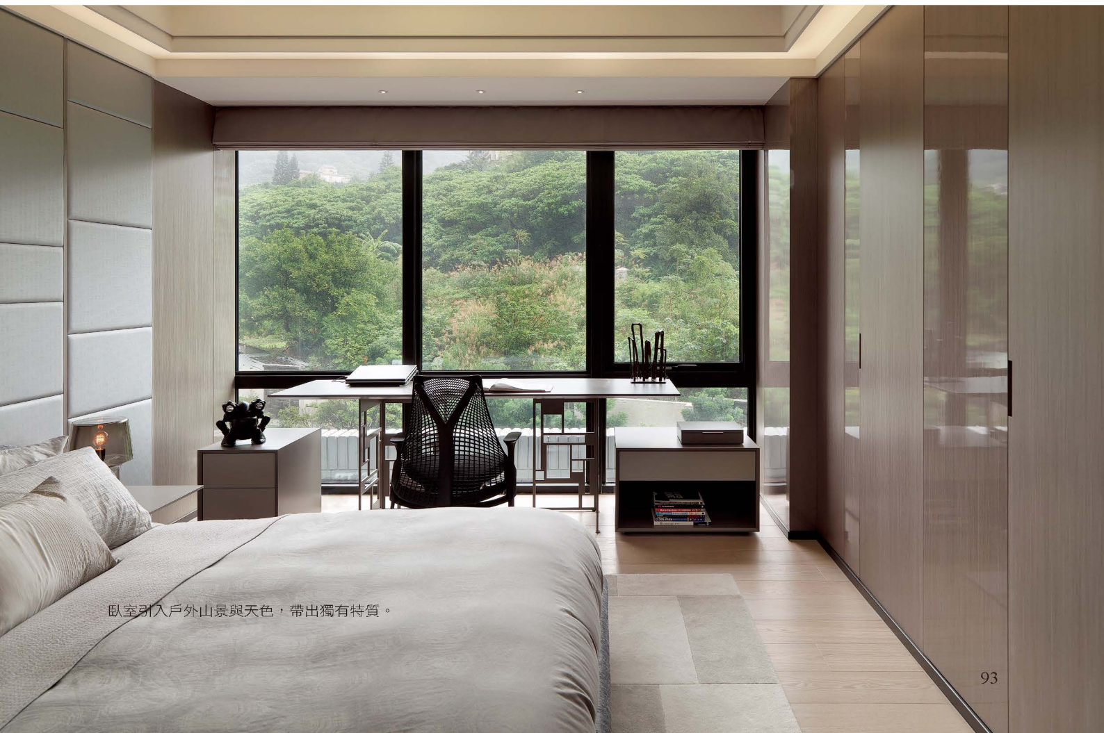
臥室引入戶外山景與天色，帶出獨有特質。