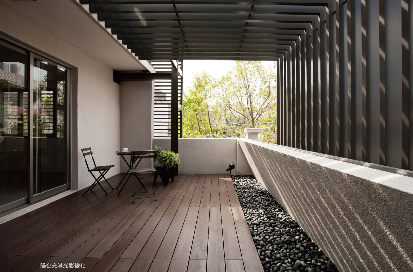
陽台充滿光影變化

以有限的經費安排這偌大量體的建構，諸如外觀改造、室內裝修、庭園造景等，要面面俱到難免有顧此失彼之慮。於是，我們在設計過程中先以大架構的思維模式，在骨架完成之後佐搭樸實材質，不求所謂的高檔建材，一則控制預算，一則關注環保，以不多著墨、回歸單純為初衷，反觀本心、領悟禪境為指標。說來容易做來難，人們一向慣於加諸表現為成就，要放空抽離，的確不容易，然而在主客觀種種條件的限制之下，我們也發現自己的心靈才是取之不盡的資源寶庫。