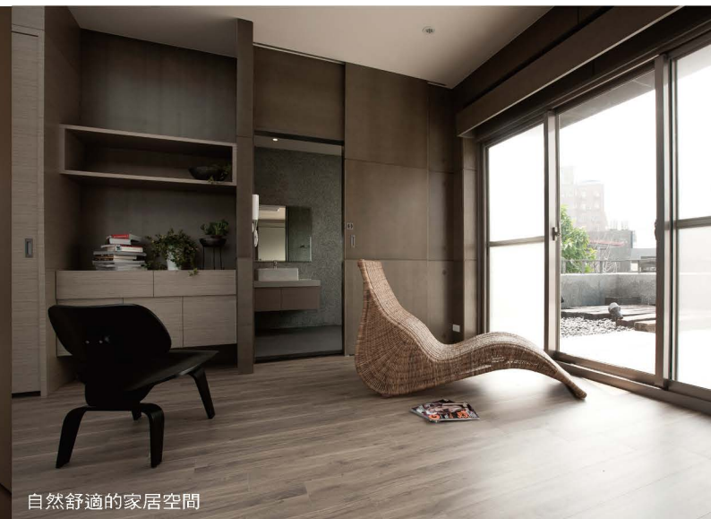
自然舒適的家居空間