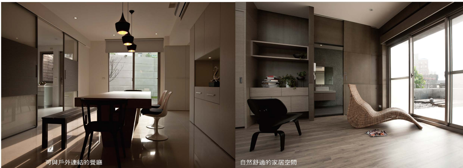
可與戶外連結的餐廳