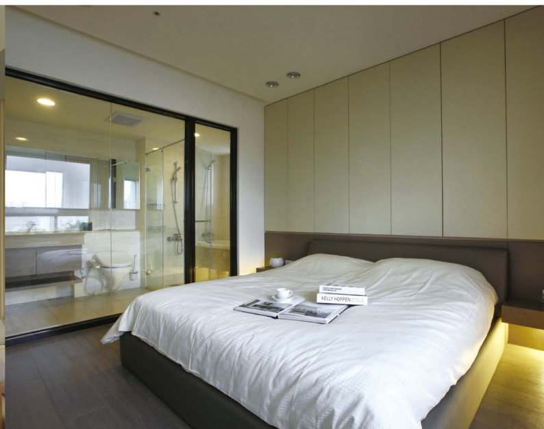
臥室以溫潤色系木地板延伸至主牆面，營造出舒適的空間感。