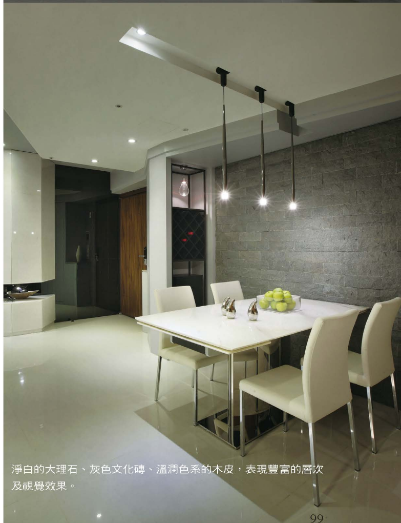
淨白的大理石、灰色文化磚、溫潤色系的木皮，表現豐富的層次及視覺效果。