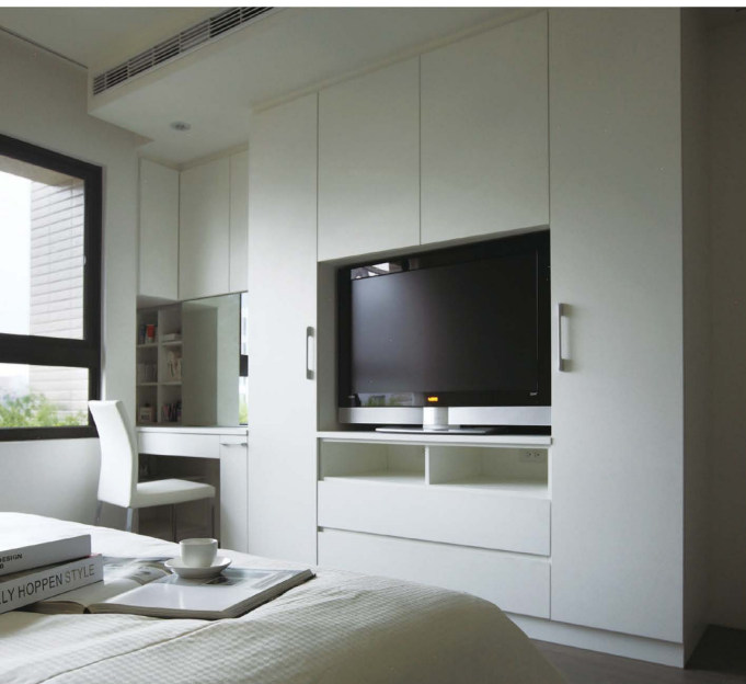
臥室色系延伸使用客餐廳的灰白色調。