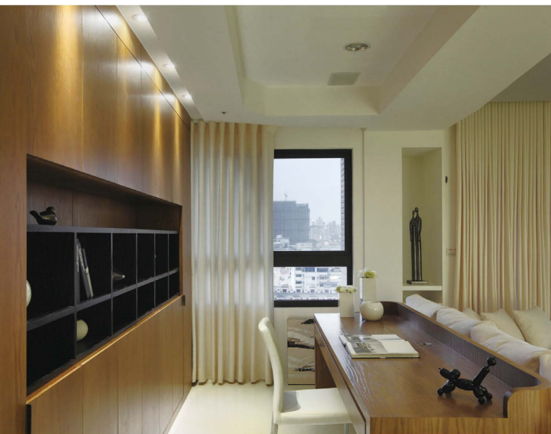
開放式書房塑造出舒適、簡單的空間氛圍。