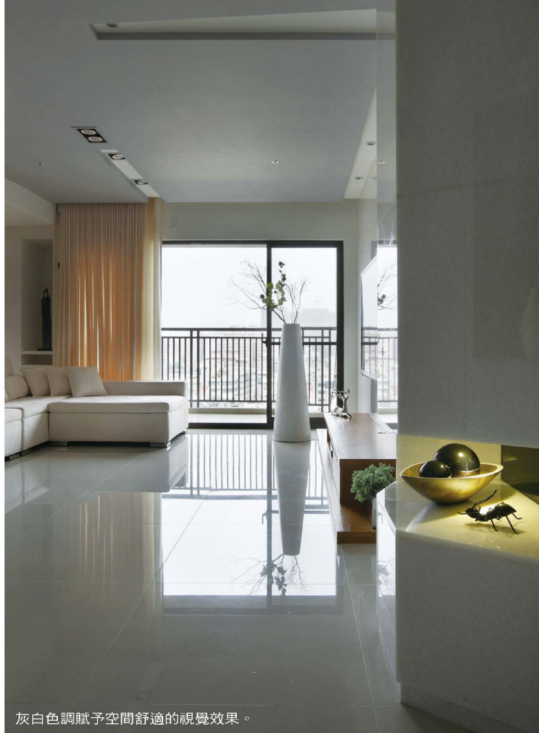
灰白色調賦予空間舒適的視覺效果。

臥室部份，木地板以溫潤的色系延伸至主牆面，搭配淺色系的棧皮營造出空間感，浴室則以大片的落地玻璃，增加空間的穿透感，虛實之間顯現出業主對於生活的品味以及享受。