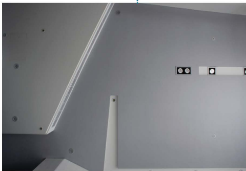
天花板運用線條幾何元素，打破既有的方正框架。