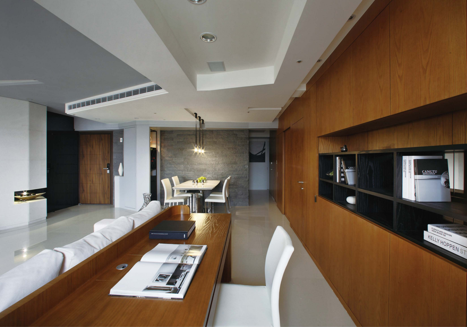
利用天、地、壁的關係使用幾何造型及不同材質、色彩變化，界定客廳、餐廳及書房的連結性。