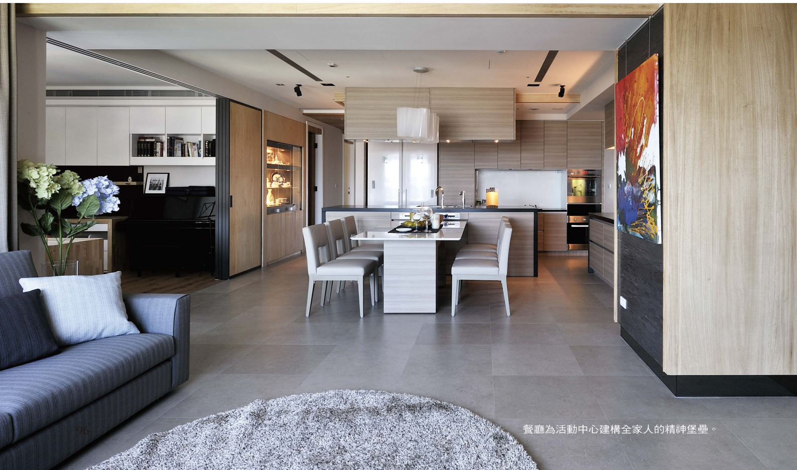
餐廳為活動中心建構全家人的精神堡壘。

過大面積的室內景觀開窗，勢必抵減可供利用的牆面，影響收納，但此建築的景觀價值絕對不可忤逆；幸運的是，我們找到一間廁所改裝的儲藏室，按計劃切開背牆形成開口，嵌入大量影音設備，藉重儲