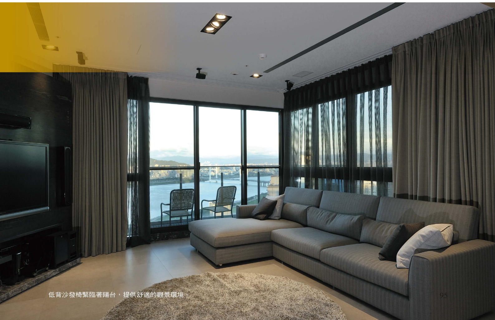
低背沙發椅緊臨著陽台，提供舒適的觀景環境。