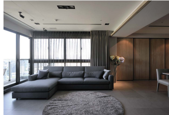
臨時隔間牆讓空間頓時沉靜下來。