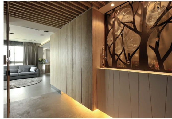
玄關設計象徵倦鳥知返的歸屬感。