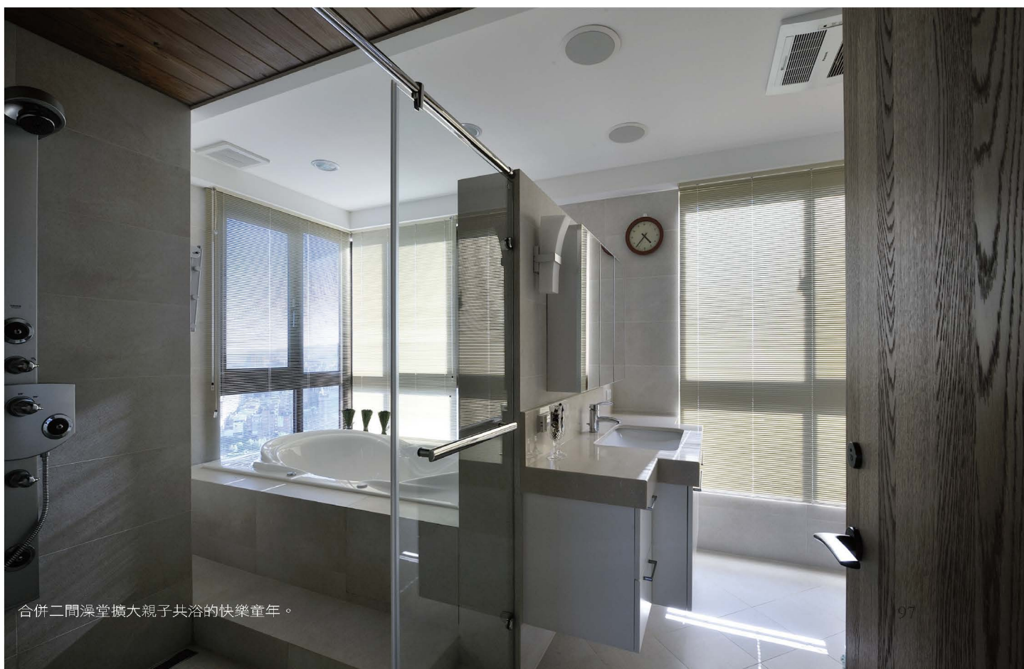
合併二間澡堂擴大親子共浴的快樂童年。